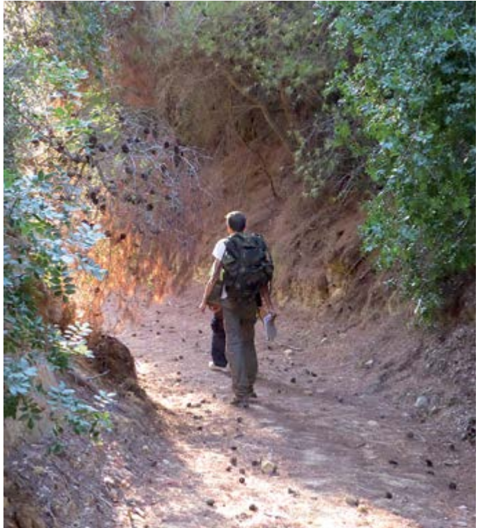
5 Περιοχή Επιταλίου, εικόνα από την επιφανειακή έρευνα | Umgebung von Epitalion, Survey, Impression Prospektionsgebiet