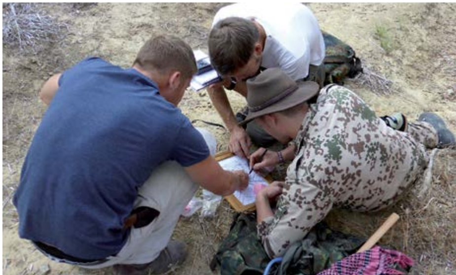
4 Περιοχή Επιταλίου, επιφανειακή έρευνα, αποτύπωση της υπό διερεύνηση περιοχής | Umgebung von Epitalion, Survey, Felddokumentation